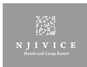
Hoteli Njivice d.o.o.