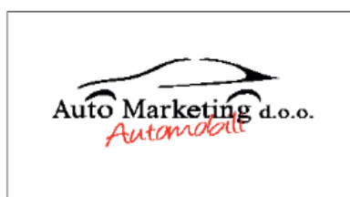
Auto Marketing d.o.o.